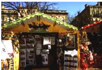
Bordeaux : le marché de Noël

nougats et marrons chauds qui répandaient une odeur agréable... Les personnes attirées se laissaient tenter par la gourmandise. Les enfants émerveillés s'agglutinaient devant les vitrines et leurs yeux scintillaient de mille feux. J'ai ressenti de la chaleur, de la