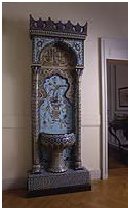
Fontaine ottomane. Émaux en relief cerné sur fond d'or. Manufacture de J. Vieillard & Cie

ciété Vieillard & Compagnie diminua ses coûts de production, élargit sa clientèle à la bourgeoisie moyenne et augmenta ses exportations. Sa production se diversifia.