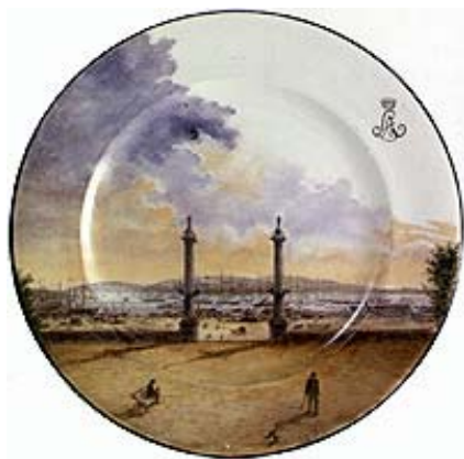
Assiette à décor peint de Marie Gadou. Manufacture de J. Vieillard & Cie Bordeaux. Musée des Arts décoratifs

Cette faïence fine ne connut à Bordeaux qu'une durée relativement limitée. Cependant elle a, au XIX ème , brillé d'un éclat vif et