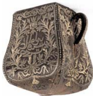
Bourse. Maroc. XIX e siècle. Laval, Musée du Vieux-Château.

face quelques œuvres de Delacroix, de l'évolution de sa palette de couleurs après son voyage au Maroc en 1832. Delacroix a vécu à Bordeaux à l'âge de dix ans : son père était préfet de la Gironde et son frère le général Delacroix est enterré