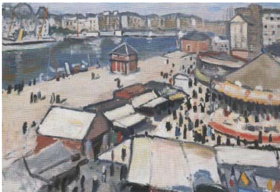
Albert Marquet : Fête foraine au Havre – 1906