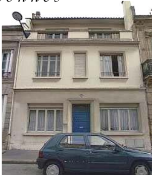
L'hôpital de jour La Cerisaie

La Cerisaie qui nous accueille au centre de Bordeaux sous son arbre tutélaire, se donne pour mission entre autre de resocialiser les personnes