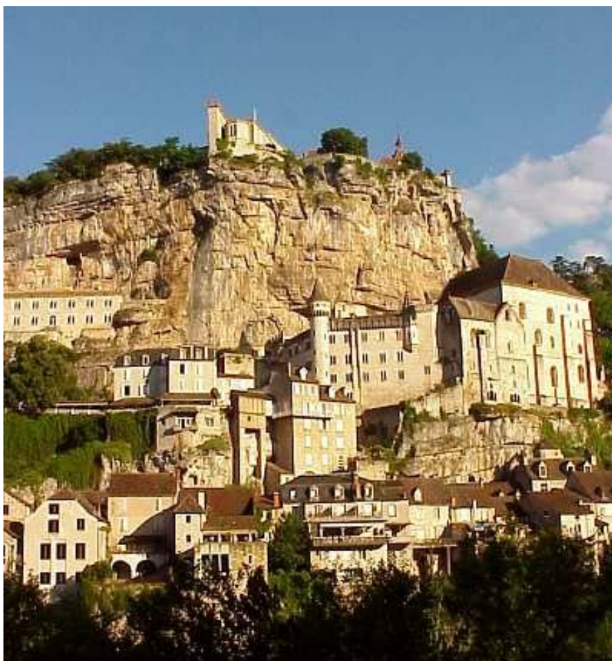
Le village de Rocamadour